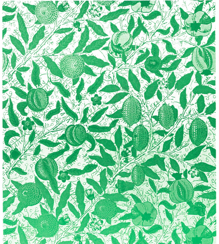
ウィリアム・モリス「柘榴あるいは果実」壁紙、1866年頃

みなさんは、ウィリアム・モリスという名前を きいたことがありますか？ ウィリアム・モリス (1834-96)は、19世紀後半のイギリスで工芸家、 画家、詩人、出版人として幅広く活躍した人です。 モリスは生活と芸術を一致させようと考え、 生活の中に、様々にデザインされたものを取り 入れました。そのため、モリスはモダン・デザイ ンの父とも呼ばれています。鳥や草花などを モチーフにした彼の美しいデザインは、100年 以上たった現在でもいろいろな場所で目にす ることができます。ステンドグラス、壁紙のデザ イン、家具、本のデザインなどなど…。みなさん の身近にもモリスがデザインしたのものがあるか もしれませんね。うらわ美術館に来て確かめて みませんか？