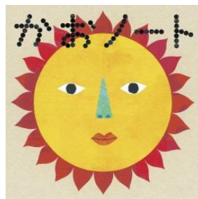
⑤ 「かおノート」 (2008年©tupera tupera/ コクヨ株式会社)