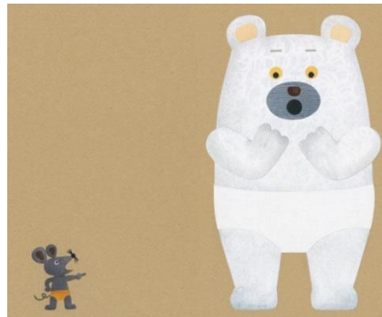
② 「しろくまのパンツ」 (2012年©tupera tupera/ ブロンズ新社)