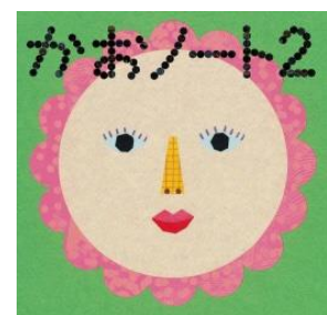
⑥ 「かおノート2」 (2010年©tupera tupera/ コクヨ株式会社)

うらわ美術館では、次のとおり展覧会を予定しております。 つきましては告知広報方、よろしくお願い申し上げます。