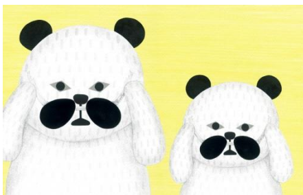
④ 「パンダ銭湯」 (2013年©tupera tupera/絵本館)