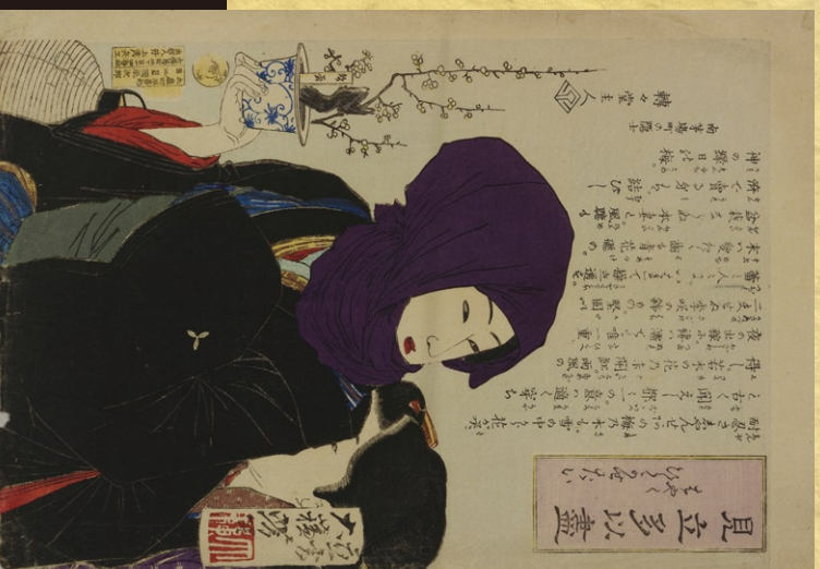
【見立たい図はやくひらかせたい】