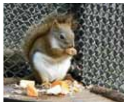
大宮公園(小動物園)