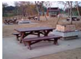
秋葉の森総合公園(ピクニック広場)