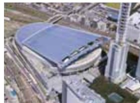
さいたまスーパーアリーナ