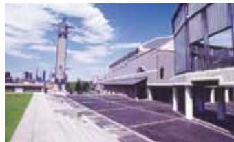
彩の国さいたま芸術劇場