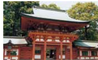
武蔵一宮氷川神社