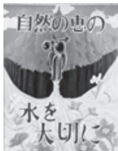
▲昨年の中学生の部 最優秀賞