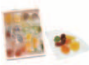
彩果の宝石(洋菓子)