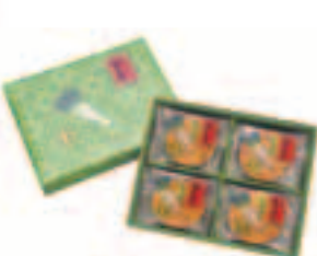
陣屋ねぎみそ煎餅(煎餅)