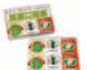
松葉納豆三色三味(納豆)

詳しくは、(社)さいたま観光コンベンションビューロー(☎647・8338、FAX647・0116、 http://www.scvb.or.jp/ )へ。