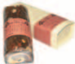
かやの木ロール(洋菓子)