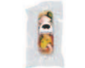
シンケンアスピック (ハムと野菜のゼリー寄せ)