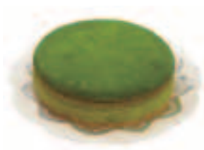
テーバール(洋菓子)