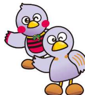
埼玉県マスコット 「コバトン&さいたまっち」

< 共 催 > 埼玉労働局・さいたま市・川越市・越谷市・川口市・所沢市・ 熊谷市・春日部市・草加市・上尾市・久喜市・埼玉県