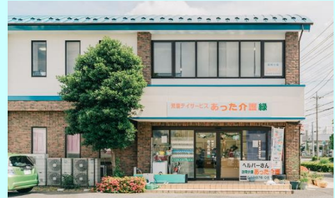
1階が放課後等デイサービスで2階が本社事務所です。