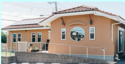
かわいい一軒家！一度見に来てください♪(デイ美園)

ダンスや運動が得意な社員、学習が得意な社員、歌やピアノ、工作や絵画、手芸や調理などそれぞれの得意なことを生かして、楽しみながら療育指導を行っています。