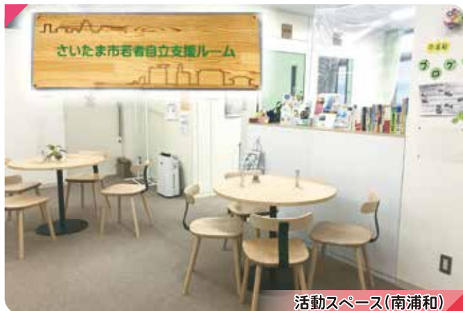
活動スペース(南浦和)