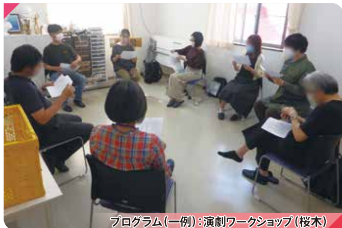
プログラム(一例): 演劇ワークショップ(桜木)