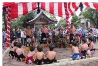
国指定 重要無形民俗文化財 「岩槻の古式の土俵入り」

■所在地：浦和区常盤 6-4-4 ■電話 048-829-1723 ■FAX：048-829-1989 ■交通：JR 浦和駅西口 徒歩 15分