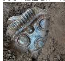
真福寺貝塚から新たに出土したミミスク土偶の頭部

Shinpukuji shell Mounds の名とともに、海外にも知られる「真福寺貝塚」(国指定史跡)では、史跡整備に向けて発掘調査で状況の把握を図るとともに史跡の公有地化を進めています。パナマ運河より古く開通した閘門式運河の「見沼通船堀」(国指定史跡)では、閘門実演を行うなどの活用を図りながら、史跡の価値を保つための再整備を進めています。指定から100年を超える国指定特別天然記念物「田島ヶ原サクラソウ自生地」では、これからもサクラソウ自生地を伝えていくため、継続的な調査を行い、市民ボランティアと協働したガイドを行うなど保全と活用にも努めています。このように、自然と調和した持続可能な整備と保存活用を通じてSDGsの目標11「住み続けられるまちづくりを」、目標12「つくる責任つかう責任」、目標15「陸の豊かさを守ろう」に貢献していきたいと考えています。