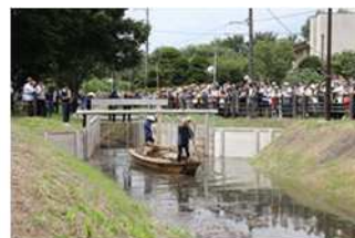
整備の進む国指定史跡「見沼通船堀」

貴重な文化・歴史・教育・観光資源である文化財の調査、助成、記録を行うとともに、市民の方への普及活用に取り組んでいます。多様な文化に親しみを持ち、地域に愛着を感じてもらうため、実演、公開、展示などを行い、これらの取組を通じて、SDGsの目標4「質の高い教育をみんなに」、目標11「住み続けられるまちづくりを」に寄与していきたいと考えています。