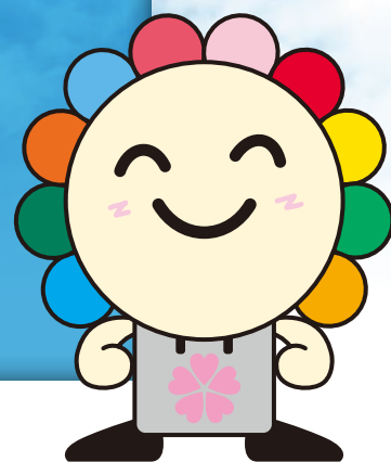
さいたま市選挙キャラクター みらいクワ