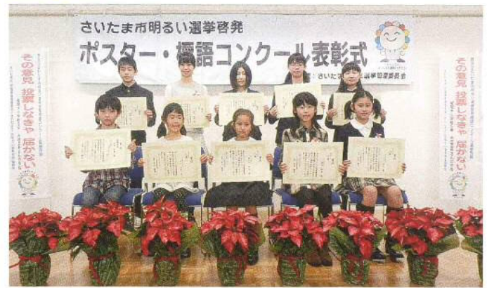
平成25年11月17日(日)に表彰式を行いました(浦和コミュニティセンター)