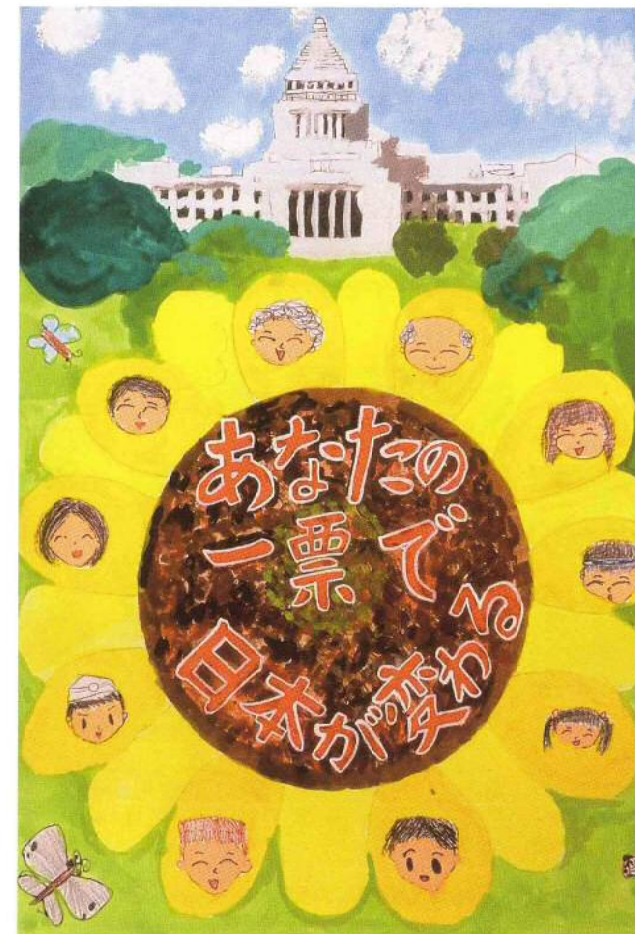
(平成25年度文部科学大臣・総務大臣賞受賞作品)