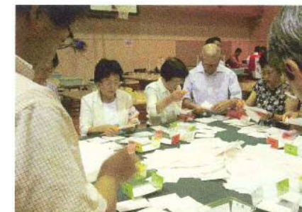
大宮区明るい選挙推進協議会の会員が、参議院議員通常選挙の開票作業に参加しました。