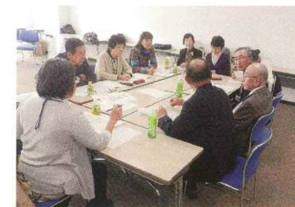
市・各区の明るい選挙推進協議会会員約40名が集まり、研究集会を行いました。

さいたま市青年選挙サポーターの会「E-Railさいたま」の会員が選挙出前講座を行い、緑区明るい選挙推進協議会の会員も参加しました。(三室小学校)