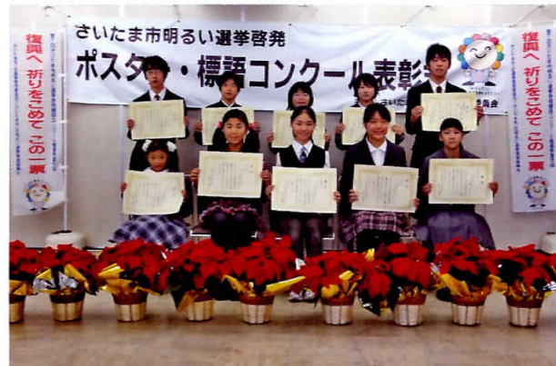
平成23年11月26日(土)に表彰式を行いました。 (大宮区役所)