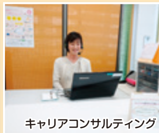
キャリアコンサルティング