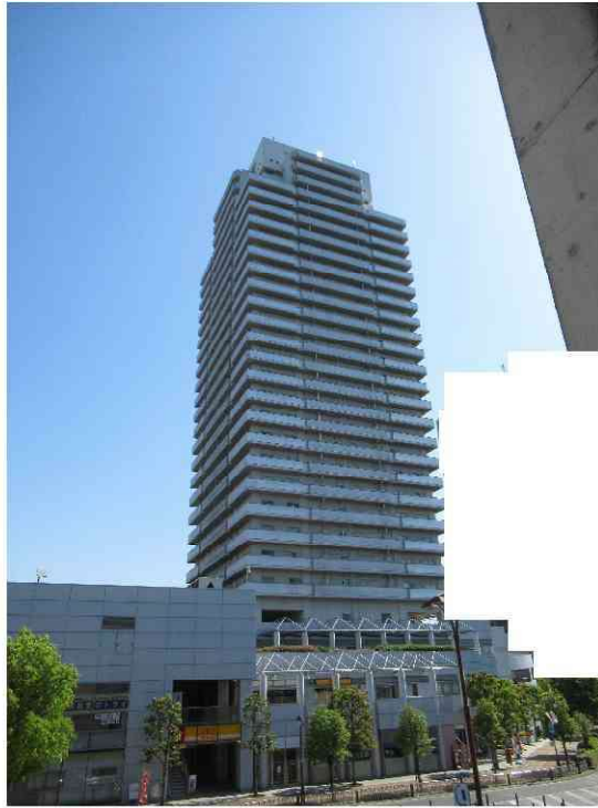
北西側から撮影 (入口付近)