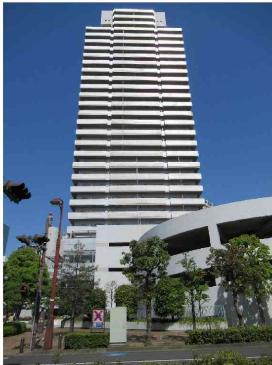
南西側から撮影（駐車場部分）