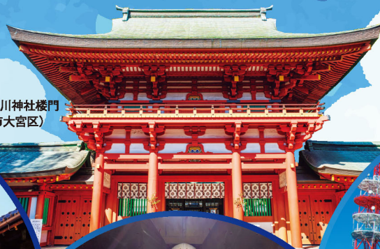
武蔵一宮氷川神社楼門 (さいたま市大宮区)