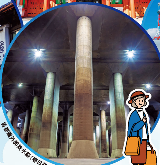
首都圏外郭放水路 (春日部市)