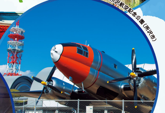
所沢航空記念公園 (所沢市)