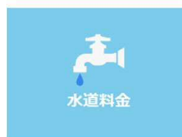
水道料金のお支払い

「Yahoo!公金支払い」( インターネットのみ )より、 【水道料金のお支払い】⇒【埼玉県】 ⇒【さいたま市 水道料金等・継続払い】を選択してください。 確認必須の注意事項 に確認・同意の上で 手続を開始してください。