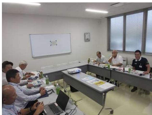
環境コミュニケーション実施状況2