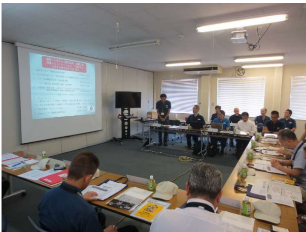
環境コミュニケーション実施状況

主催事業者による事業概要や、環境対策などの報告及び所内見学を受け、参加者から「環境対応・対策に取り組んでいることが分かり安心できた」との声がありました。