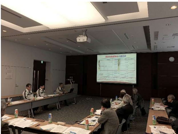
三菱マテリアル株式会社事業報告

三菱マテリアル株式会社では、この説明会を継続して実施しており、市民への積極的な情報公開を行っています。