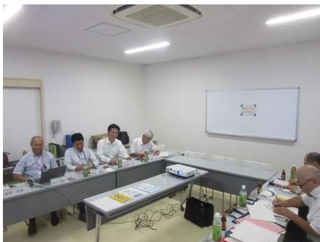
環境コミュニケーション実施状況1

環境コミュニケーションを受け「環境・安全対策に力を入れていることが分かりとても安心した」との参加者の声がありました。