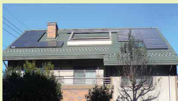
太陽光発電システム