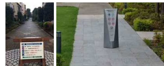
サイン(看板)設置イメージ<移動できるもの> (看板の具体のデザイン・文言は協議会で決定)