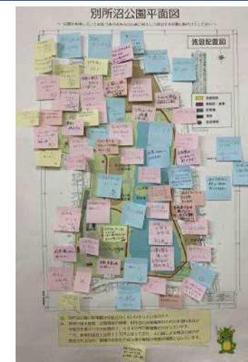
ワークショップの結果