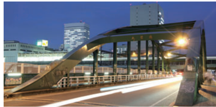
▲大宮駅の夜景に映える大栄橋。当時1100余点の応募の中から決定したこの橋の名称、実は「たいえいばし」と読みます。