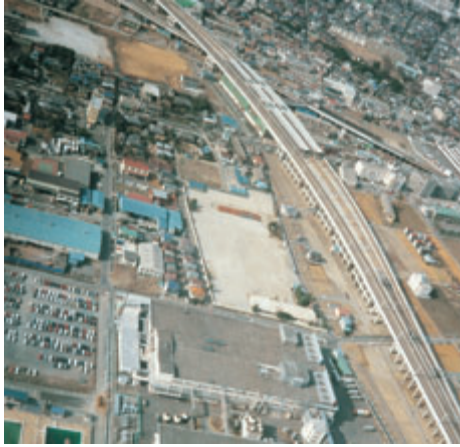
◀開設間もないころの武蔵浦和駅周辺。上が大宮方面、下が東京方面、線路の左側は、昭和39年に開業したロッテ工場。まだ、高層ビルは1棟もありませんでした。