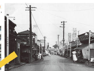
昭和33年の駅前通り