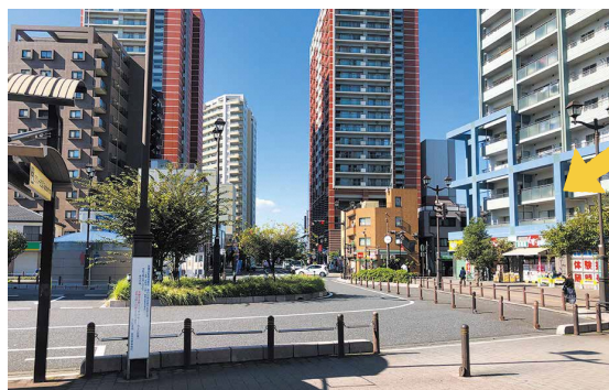
駅西口の駅前交通広場と駅前通線