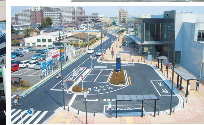
新たに開設された駅北口