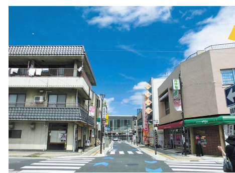
駅南口の駅前交通広場から続く日進七夕通り