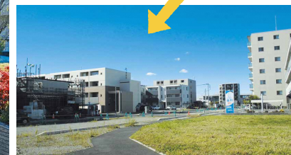
整備進行中の駅南口周辺