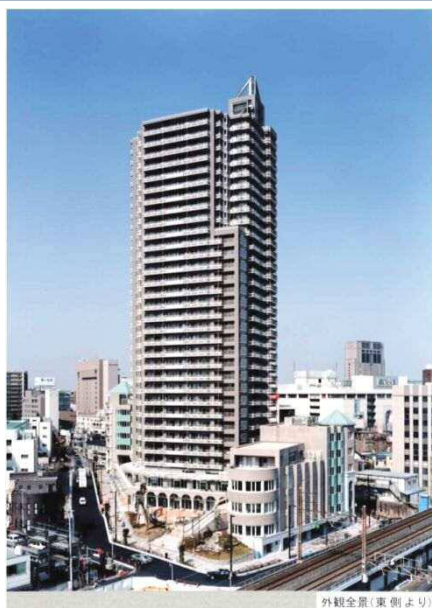
外観全景(東側より)