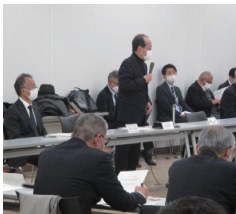
▲第1回大宮 GCS まちづくり調整会議の様子

今後は、各プロジェクトチーム（PT）での検討を深度化し、2月に開催予定の「第2回大宮GCSまちづくり調整会議」において、今年度の成果をお示しする予定です。