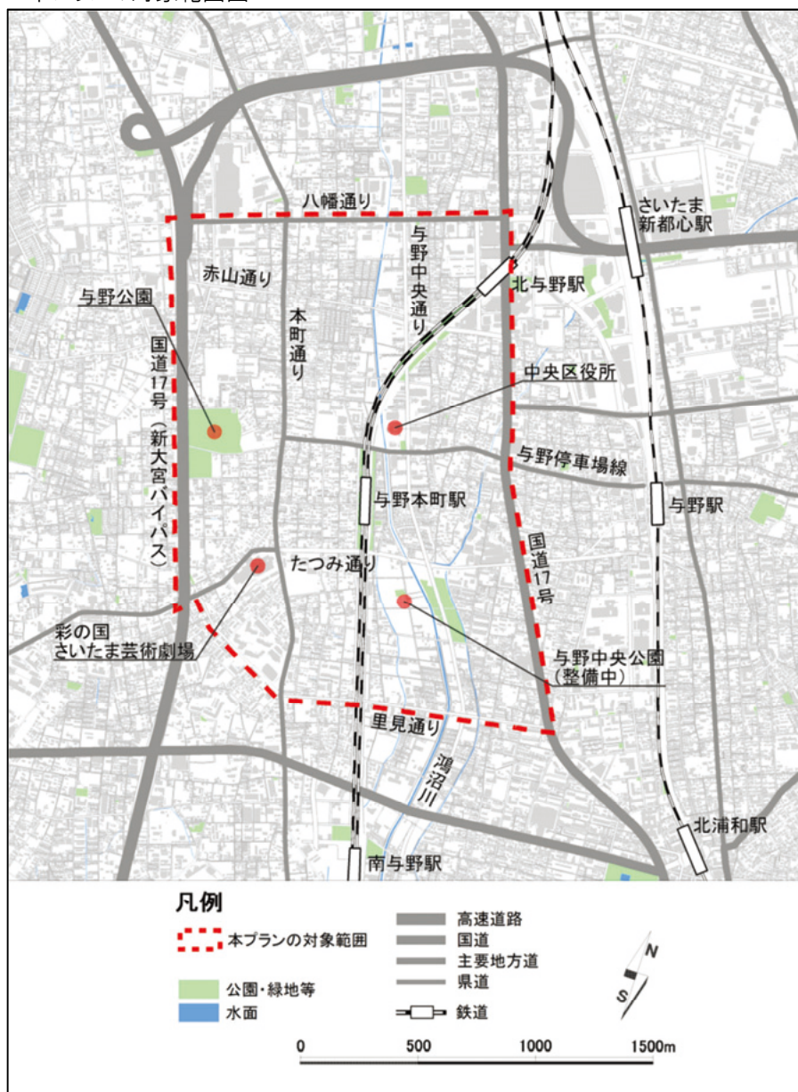
■本プランの対象範囲図

本プランでは、JR 埼京線の与野本町駅を中心に、中央区役所や与野公園、与野中央公園、芸術劇場などの主要施設を含む、約 280 ヘクタールを対象範囲としています。