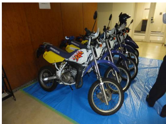
災害時に周辺の道路状況を把握するバイク隊