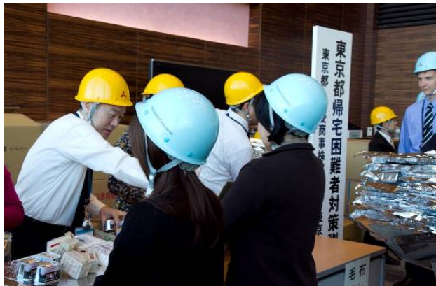
（企業における一斉帰宅の抑制の訓練 東京会場）

平成24年2月3日に実施した「帰宅困難者対策訓練」では、東京駅会場において、自衛消防訓練と連動させた「一斉帰宅抑制訓練」を実施しました。