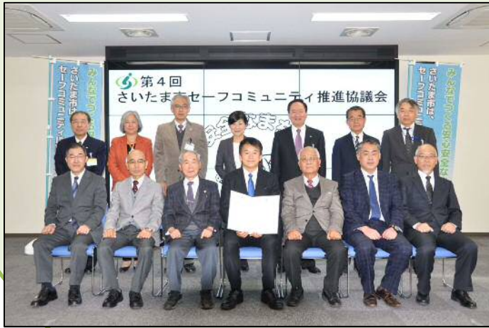
↑さいたま市セーフコミュニティ推進協議会委員