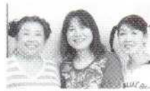
ご存知さいたま寿座