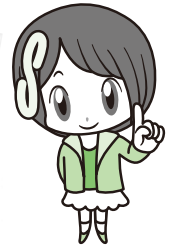
さいたま市消費生活総合センター マスコットキャラクター さいたましゅこちゃん

2020年の東京オリンピック・パラリンピックや2025年の大阪万博などを控えキャッシュレス化が推進されるなか、支払方法が多様化・複雑化し、よく理解しないでキャッシュレス決済したことが悪質業者に利用され消費者トラブルにつながる、というケースも多くなっています。