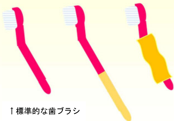
↑標準的な歯ブラシ

A23. 歯ブラシは「ふつう」のかたさのものがおすすめですが、歯ぐきから出血がある場合や歯ぐきが腫れている場合は、「やわらかめ」のものをおすすめします。大きさに関しては、歯やお口の大きさに合ったものを選びましょう。障害により腕が上がりにくい場合は、割り箸などを巻き付けて柄を長くしたり、歯ブラシの柄をうまく握れない場合は、柄にガーゼなどを巻いて太くするなど、歯ブラシの改良を行いましょう。