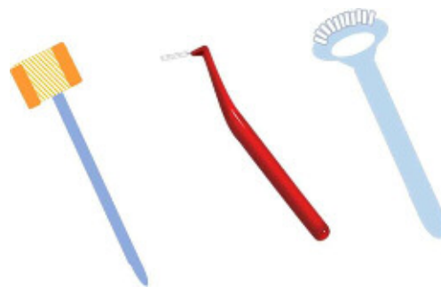
左から、スポンジブラシ 歯間ブラシ 舌ブラシ

本人の負担を可能な限り軽減するために、歯ブラシの他に、便利な清掃補助具(スポンジブラシ・歯間ブラシ・舌ブラシなど)をうまく活用して下さい。(使い方は、「障害がある方への口腔ケアに関するQ&A」、p.1、A1. 参考)