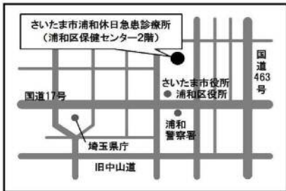
▼さいたま市浦和休日急患診療所