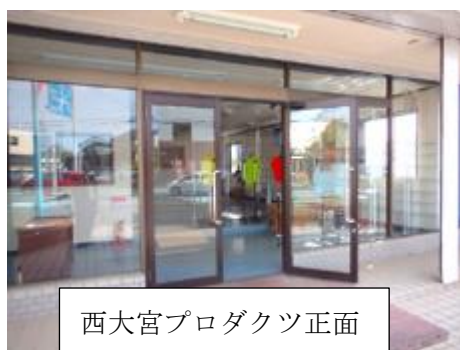
西大宮プロダクツ正面