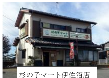
杉の子マート伊佐沼店

事業の展開に当たってはご利用者の人権を尊重し、権利擁護・虐待防止に努めご利用者の意思・能力を生かした支援により、ご利用者自身が主体者として活動できるように支援しています。