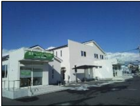
湯澤トレーニングセンターと併設されている湯澤整形外科リハビリクリニック