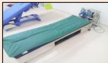
ミルキングアクション

機械で足首を動かし、「第二の心臓」と言われるふくらはぎの筋肉を動かすことで血液の循環を促します。