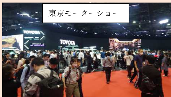
東京モーターショー