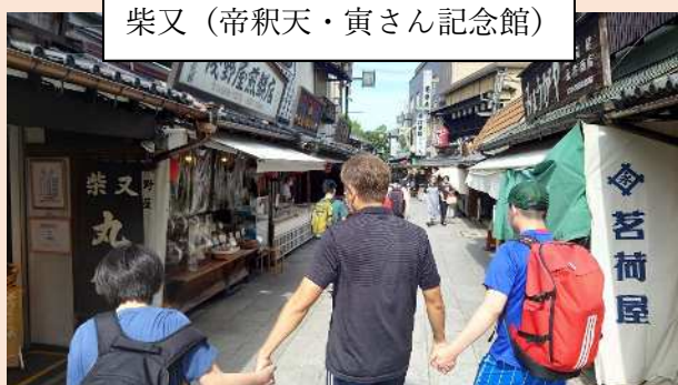
柴又 (帝釈天・寅さん記念館)