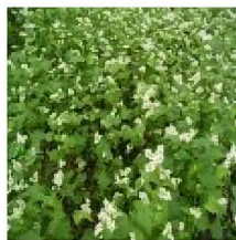
秩父そば打ち・そばの花