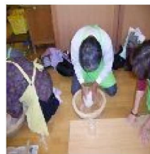
初めてのそば作り