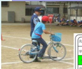
H25.7.3南浦和小学校で撮影