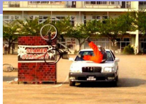
H26.4.23馬宮中学校 で撮影