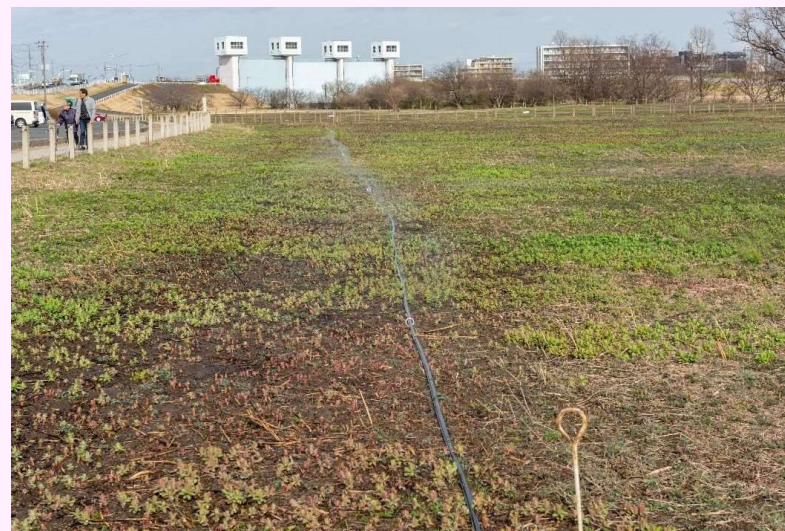
灌水実験調査の様子