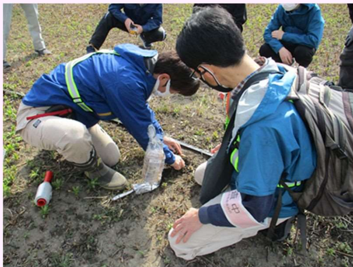
土壌成分分析調査の様子