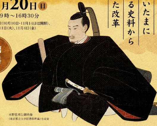
水野忠邦公卿肖像 (東京都立大学蔵書複製画を複製)