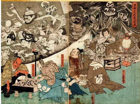
源頼光公館土蜘蛛妖怪怪図(東京都立・大田区蔵複製画) (天保の改革の風刺)