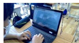
ICT を活用した探究活動

本校は、総合的な学習の時間「3 G Project」において、2年生の生徒全員が半年間をかけ、SDGs の 1