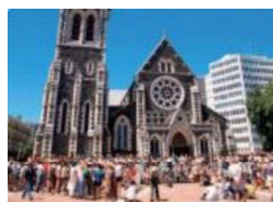
ニュージーランドの現地の様子

本校は、生徒全員が 3 年生でニュージーランドを舞台にフィールドワークを行います。現地の連携校のいくつかは SDGs に