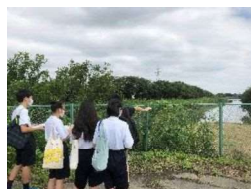
学校近隣のフィールドワーク

本校は、芝浦工業大学と連携し、SDGs の視点でさいたま市の諸課題について意見交換をしています。実践的な活動の 1 つとして、大学生と一緒に学校の近くへ