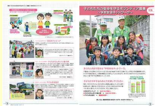
市報さいたま12月号掲載記事

学校安全ネットワークのPRとボランティアの募集を呼びかける記事を市報に掲載しました！