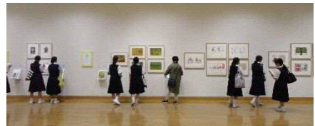
鑑賞学習の受入れ

当館では、鑑賞学習の受入れ等の学校連携事業「うらびいスクールサポートプログラム」や、生涯学習関連施設と連携した講座、また外部講師によるワークショップを行っています。これらの教育普及事業において、子どもからシニアまでの幅広い世代に対し、美術鑑賞や制作等、美術館の特性を生かした学びの機会を提供することで、SDGs の目標 4「質の高い教育をみんなに」、目標 17「パートナーシップで目標を達成しよう」に寄与していきたいと考えています。