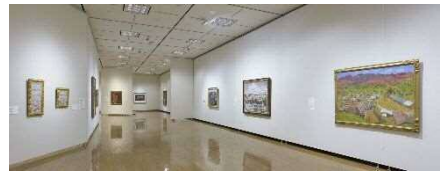
ここが見どころ スポットライト！うらわ美術館展 2017 年

当館の作品収集方針「地域ゆかりの作家」「本をめぐるアート」に基づいて、さいたま市の文化財資源であるコレクションを充実させるとともに、調査研究の成果を展覧会で公開しています。これらの美術館活動を地域に根差して行い、市民遺産を未来へと継承し続けていくことで、SDGs の目標 11「住み続けられるまちづくり」に貢献していきたいと考えています。