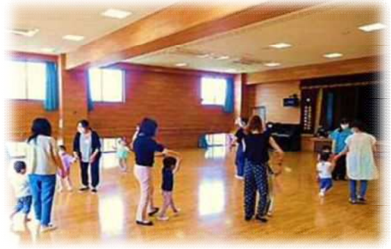
田島公民館（桜区） 【親子リトミック②のびのび】