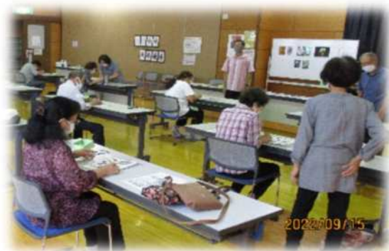
三橋公民館（大宮区） 【介護予防事業／みはしいきいき学級③切り絵に挑戦しよう】