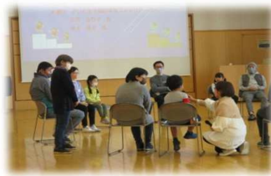
生涯学習総合センター 【親の学習事業「親子かけっこ教室&おしゃべりプログラム」】