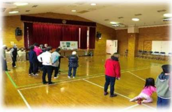
大古里公民館（緑区） 【ボッチャ体験教室】