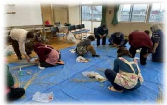
植水公民館（西区） 【しめ縄飾りづくり教室】