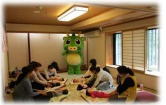
岩槻本丸公民館（岩槻区） 【子育てサロン「まんまる」】