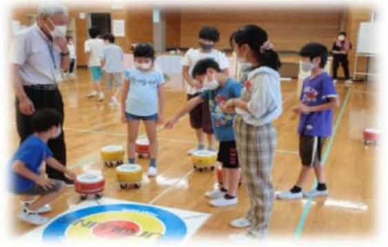
東浦和公民館（南区） 【夏休みこども公民館 「フローカーリングを楽しもう」】