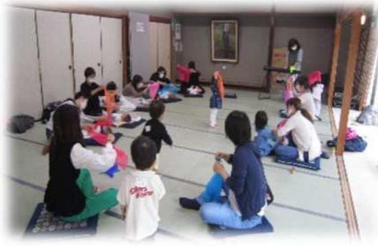
岸町公民館（浦和区） 【子育てぴらっとサロン】