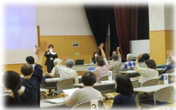
生涯学習総合センター 【市民大学 市民企画コース】