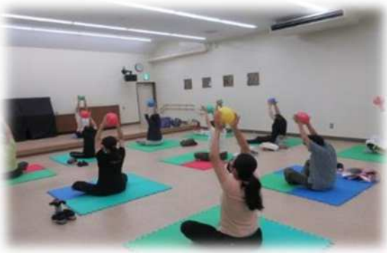
大戸公民館（中央区） 【青少年・若者支援講座 バランスボール教室】