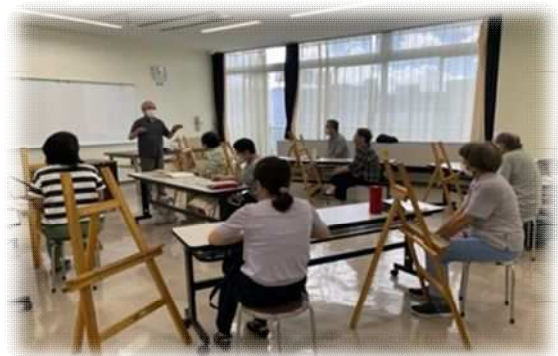
日進公民館（北区） 【基礎から学ぶ「デッサン教室」】