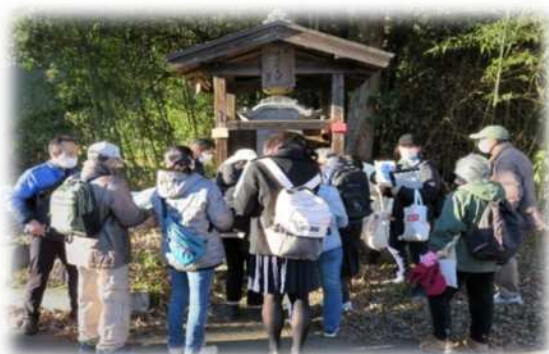
大砂土東公民館（見沼区） 【見沼区学へのいざない】