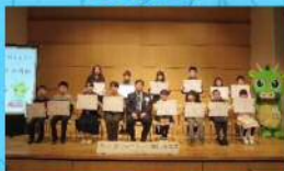
昨年度表彰式の様子