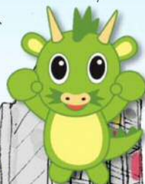
さいたま市 PR キャラクター つなが竜ヌウ