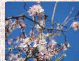
ジュウガツザクラ