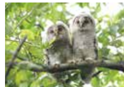
フクロウ(巣立ち雛)