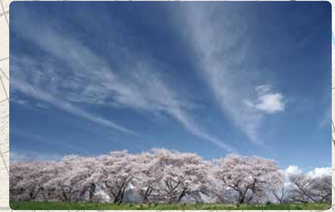
鴨川堤桜通り公園