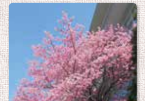
プリンセス雅(みやび)