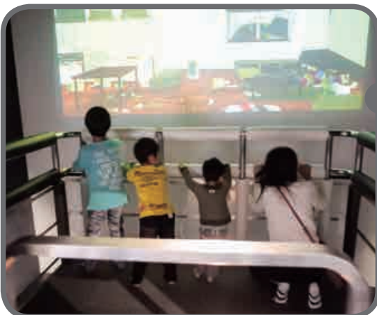
地震体験コーナー

地震発生のしくみや対処方法などを震度1～7までの地震の揺れを体験しながら学習することができます。今後発生が予想されている地震や、過去の大地震についても体験できます。