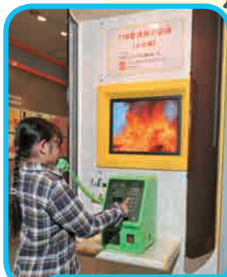
119番通報体験コーナー

火災や事故が発生したとき、落ち着いて正しく119番へ通報ができるよう模擬通報を体験するものです。