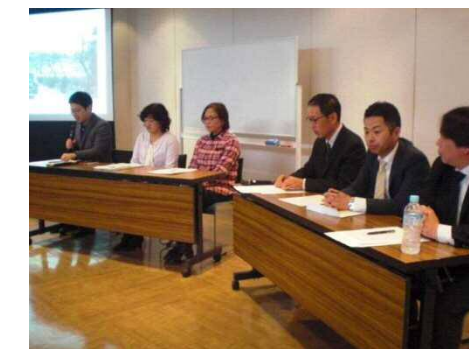
平成28年度報告会の様子

日時：平成30年3月14日 18時30分から20時30分 場所：岩槻駅東口コミュニティセンター多目的ルームB 参加予定数：60名