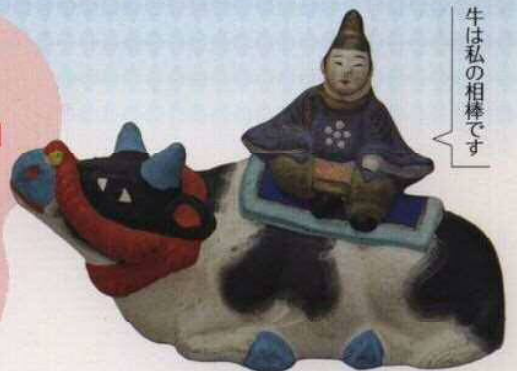
伏見土人形 牛乗天神