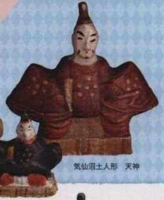
気仙沼土人形 天神