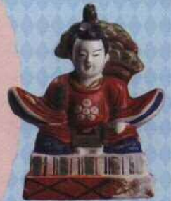
十日市(三次)土人形 松貞天神