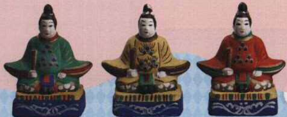
出雲今市土人形 五色天神の内三体

年が明ければ、受験シーズンがはじまり、天神さまのシンボルである梅の蕾もほころびます。子どもにゆかりの深い学問の神となり、親しみやすい姿となった天神さま。四季の春、人生の春。和やかな姿に、待ち遠しい春を感じてください。