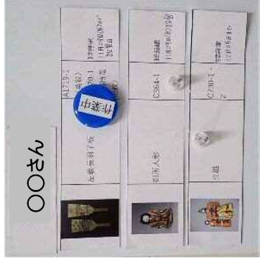
担当者ごとの修復室の貼り出し。期限を 記載し、各修復者の担当と締め切りが相 互にわかるようにしている。