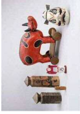
向かって右から 菟足神社の鍾馭面 (豊知県)、会津張子の赤べこ (福島県) 草津の狸々 (滋賀県)、各地の蓑長持表 (長野県など)

期：2022年4月29(金・祝) ~8月21日(日) 概要：展示室3の半分のスペースを用いて開催予定。郷土玩具を扱ったシリーズ。コロナ禍で癒しが求められる昨今、縁起が良く、愛らしなものの人気が高まっている。館蔵の日本各地の郷土玩具なかから、病魔退散の祈りが込められた赤色の玩具と、寺社仏閣の縁日などで出されたお守り・縁起物を紹介する。さらに、さいたま市内の郷土玩具として五間張子をとピック展示する。