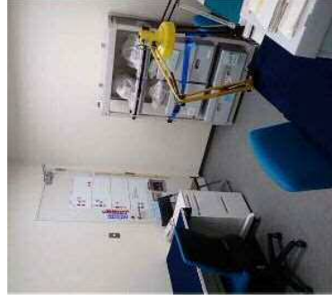
修復室の様子 恒温恒湿の空調管理エリアに含まれてい る。