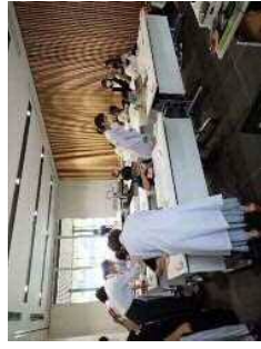
ワークショップ補助