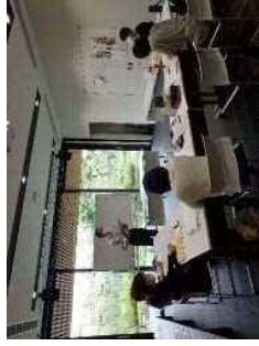
ボランティア研修

現状の5名は、4月より小学校の校外学習における映像学習の解説やワークショップの補助で実績を積んでいる。ボランティア研修については、5回目(15時間程度)が終了した。今後は3月までに4回ほど研修を行う予定である。