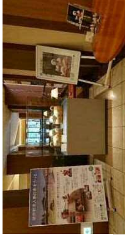
ロイヤルパインズホテル浦和