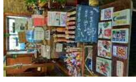
【古民家カフェいっつき】