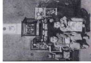
寄贈者提供の古写真 大連にて雑人形と

関連行事：講演会、ワークショップ、展示解説 刊行物：パンフレット (A4・8ページ程度、無償頒布予定)