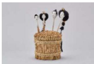
桐塑頭の完成品 松ロー栄製作 個人蔵