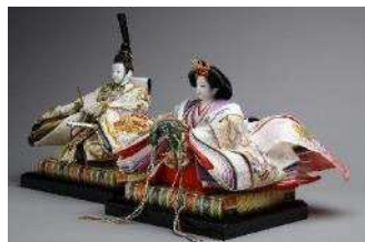
内裏雛 大塚正男製作 個人蔵