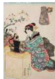
「豊歳 五節句ノ遊」 上巳の節句 歌川国貞 天保4~5年 183~4頃