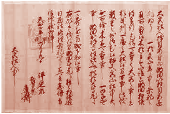
北条家裁許状 (武蔵一宮氷川神社蔵)